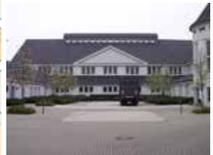
Interhydraulik 15