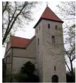
Friedenskirche 22