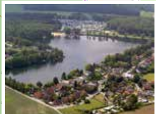
Ternscher See 25