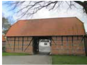
Torhaus Hof Baumeister 3